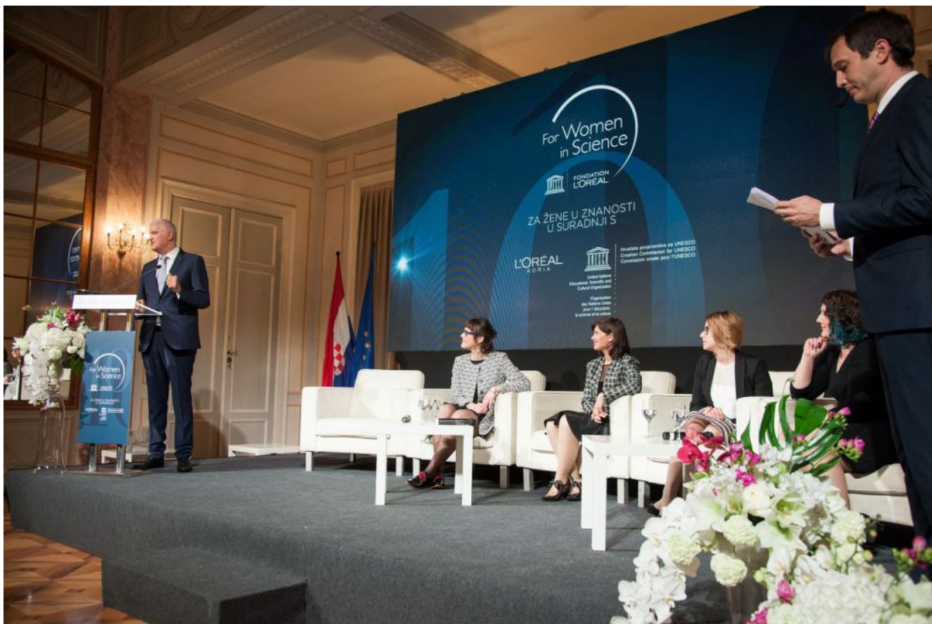
Stipendistice i predsjednik HAZU-a i Izbornog povjerenstva programa akademik Zvonko Kusić

Ove godine partneri programa napravili su još jedan iskorak u promicanju uloge žena u znanosti pokretanjem Manifesta Za žene u znanosti , kampanje kojom se želi potaknuti znanstvenu zajednicu i širu javnost na uključenje u brže stvaranje promjena za žene znanstvenice. Kampanja se temelji na online potpisivanju ostavljanjem osnovnih podataka kojim se izražava slaganje sa šest osnovnih načela Manifesta. Potpisnici Manifesta tako se zalažu za poticanje djevojaka na istraživanje mogućih puteva svojih znanstvenih karijera, za rušenje barijera koje znanstvenice sprječavaju da dugoročno slijede i razvijaju svoje karijere u istraživačkom radu, za otvaranje pristupa ženama na više i vodeće položaje u znanosti kao prioritetu, za promicanje doprinosa žena znanstvenica u znanstvenim spoznajama i društvu u široj javnosti, kao i za osiguravanje ravnopravnosti spolova sudjelovanjem i vođenjem simpozija i znanstvenih povjerenstava te za promicanje mentorstva i umrežavanja za mlade znanstvenike koji će im omogućiti planiranje i razvijanje karijera koje zadovoljavaju njihova očekivanja. Vrijednost ovog programa prepoznalo je 115 zemalja svijeta te je u 18 godina postojanja nagradio preko 2000 mladih znanstvenica koje su svojim radom ustrajno dokazuju kako svijet treba znanost, a znanost treba žene jer žene u znanosti imaju moć promijeniti svijet.