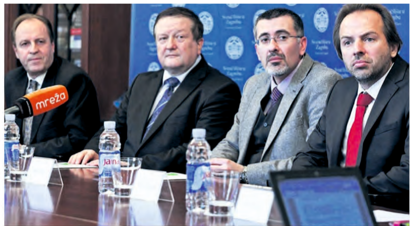
Potpisivanje ugovora između Sveučilišta u Zagrebu, Fakulteta kemijskog inženjerstva i tehnologije kojim se osnovala spin-off tvrtka Comprehensive Water Technology/PIXSELL